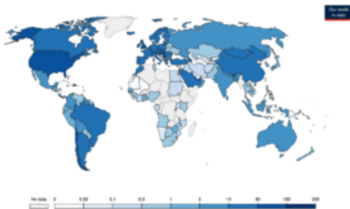
Figura 1. Dosi di vaccino distribuite per 100 abitanti; sono prese in considerazione anche le singole dosi, sebbene la maggior parte dei vaccini risultino completi dopo una doppia dose. Dati aggiornati al 7 Aprile 2021, fonte: Mathieu et al., 2021. A global database of COVID-19 vaccinations. Nature human behaviour, 1-7.